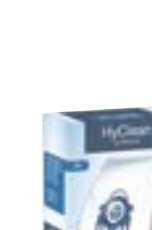
G/N HyClean 3D Originalie 'Miele' putekļu maisi