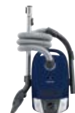
Compact C2 EcoLine SDAG1