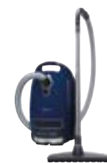
Complete C3 Parquet PowerLine SGSE1