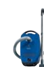
Classic C1 Junior PowerLine SBAD0