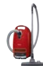
Complete C3 HEPA PowerLine SGFCO