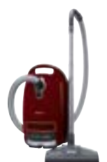
Complete C3 Cat & Dog PowerLine SGEE1