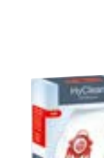
F/J/M HyClean 3D Originalie 'Miele' putekļu maisi