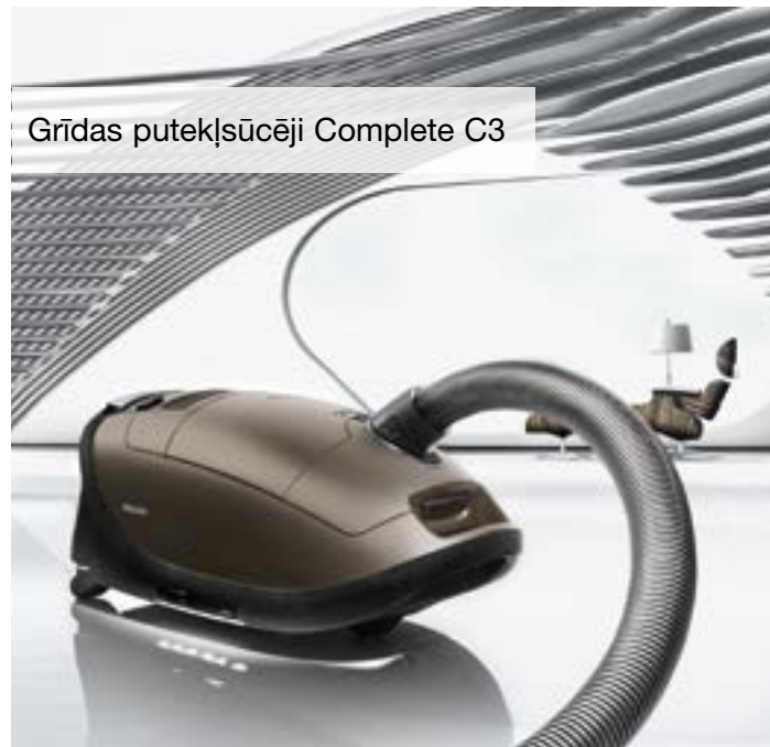
Grīdas putekļsūcēji Complete C3