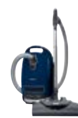
Complete C3 Electro Plus EcoLine EcoLine SGSH2