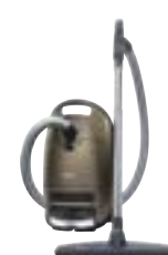
Complete C3 Brilliant EcoLine SGSH1