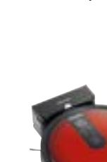
Scout RX1 Red SJKL0