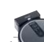
Scout RX1 SJKL0