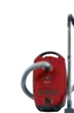
Classic C1 PowerLine SBAD0